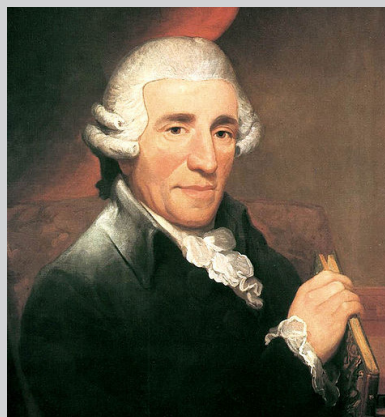
Joseph Haydn 1791, Ölgemälde von Thomas Hardy

Junge MusikerInnen werden auf verschiedenen Instrumenten Werke im Gedenken der Komponis- ten Joseph Haydn († 1809), Georg Friedrich Händel († 1759), Felix Mendelssohn Bartholdy (* 1809), Isaac Albéniz († 1909) und Frédéric Chopin († 1849) interpretieren.